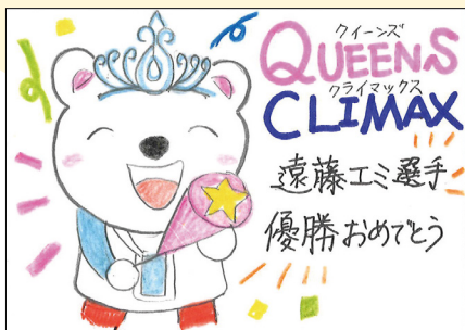
🍡ひかちゃん(大阪府)