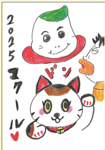
🍡イクエモン(東京都)