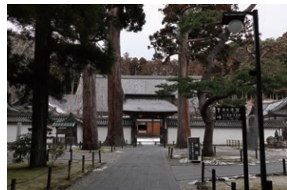
伊達政宗の菩提寺「瑞巖寺」

2022年の急勾配の表階段が有名だが、駐車場は上にもあるので階段が心配な人はそちらを利用しよう。煌びやかな社殿が迎えてくれる。 塩竈市から松島町までは車で25分ほど。松島では湾内を巡る観光船に乗るもよし、「瑞巖寺」で伊達家に伝わる宝物を堪能するもよし。ボートファンにとつて日本三景と言えはなんとと言っても「安芸の宮島」ではあるが、BTSを訪ねるついでに日本三景・松島を訪れ、日本三景もついでにコンプを目指すというのもありだろう。 大郷町内で行っておきたいのは「道の駅おおさと」。餅が大郷町の名産品だそうで、切り餅や団子、ずんだ餅など餅好きにはたまらないラインナップが。そしてもちろん季節の野菜も数多く販売されている。シーズンではなかったの