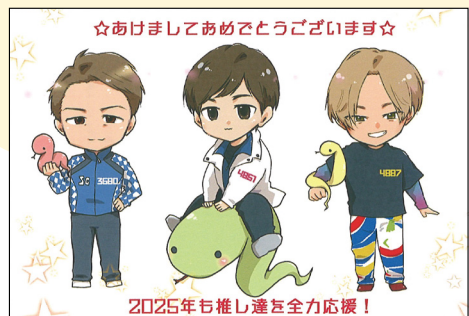
☆あけましておめでとうございます☆

ある日の徳山ボート締切3分前の窓口でのオッサンらの会話。「早よーせ、1ー2ー4、1本やで、早よーせんと売り切れるで！」(笑)。