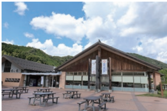
道の駅但馬のまほろば