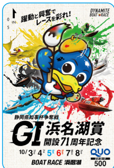
6 浜名湖 浜名湖賞 記念クオカード (10名)