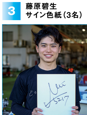
3 藤原碧生 サイン色紙 (3名)