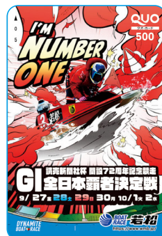
全日本覇者決定戦 記念クオカード (10名)