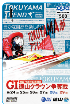
徳山クラウン争奪戦 記念クオカード (10名)