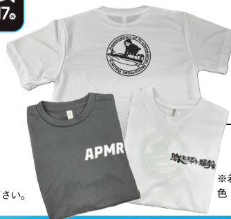
12 選手会Tシャツ (6名)