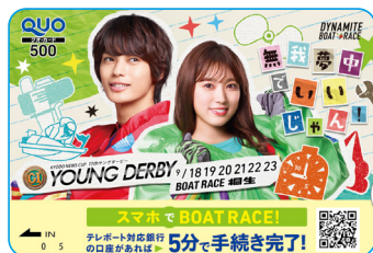
4 桐生 ヤングダービー 記念クオカード (10名)