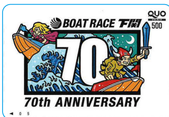
開設70周年 記念クオカード (5名)